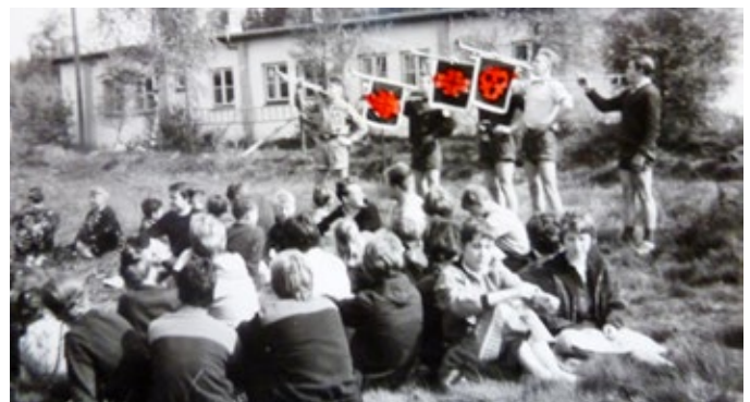
Die ersten Fanfarenbläser im Lager der Turnerjugend des TSV Plön in Trappenkamp