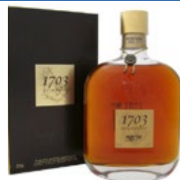
Rum – Gin – Whisky