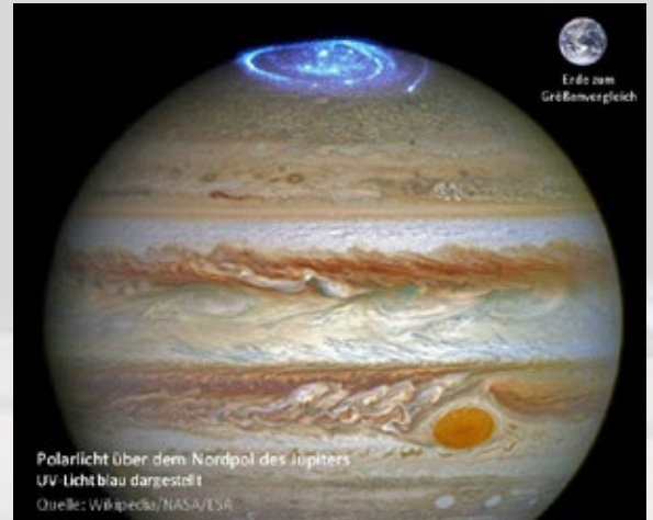
Polarlicht über dem Nordpol des Jupiters UV Licht blau dargestellt

piter mit dem zwölffachen Erddurchmesser auch deutlich größer als die Erde. Erstaunlicher war, dass auch die von den zahlreichen Jupitermonden auf dem innersten Jupitermond Io ausgestoßenen elektrisch geladenen Teilchen durch das starke Magnetfeld des Jupiters in die Polarregionen des größten Planeten umgelenkt werden. Und dort regen sie die Atmosphäre des Jupiters zum Leuchten an, mehrere hundert Mal energiereicher als die Nord- und Südpolarlichter auf der Erde. Der Io ist der innerste der vier großen Monde des Jupiters und umkreist diesen in einem Abstand nur wenig weiter weg als unser Mond von der Erde. Die Anziehungskräfte des Jupiters sind allerdings deutlich größer als die der Erde und deshalb wird der flüssige Kern des Io bei jedem Umlauf kräftig durchwalkt. Dies wiederum verursacht ständige Vulkanaktivitäten in und auf der Kruste des Io. Dieser März bietet eine Reihe an Besonderheiten. Gleich frühmorgens am 1. März zieht der